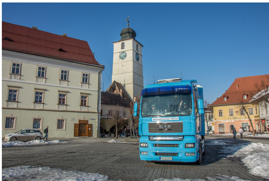
TIRul Traseului European („Reformationstruck“) în Piața Mare la Sibiu. (Poza se găsește pe http://www.evang.ro/ro/presa/ în varianta de 300 dpi.)

Pentru această festivitate Biserica Evanghelică C. A. din România (B.E.C.A.R.) se prezintă pe plan internațional printr-un film: https://www.youtube.com/watch?v=20EFJ3YjOr0