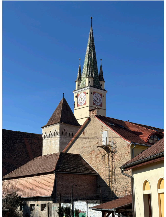
Die Kirchenburg in Mediasch verzeichnet nach der Pandemie aufsteigende Gästezahlen.

Was den Gottesdienstbesuch anbelangt, gestaltet sich dieser regelmäßig so wie im Halbjahresplan vorgesehen, wobei die Stadt Mediasch jeden Sonntag und jeden großen Feiertag Gottesdienst hat, und die Bezirksgemeinden alle zwei Wochen, bzw. alle vier Wochen, oder im Monatsrhythmus Gottesdienstangebote oder Abholdienste geplant sind.