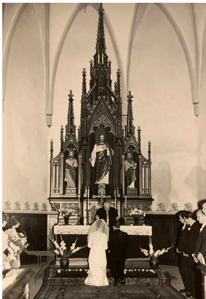
Gemeinsame Religiosität kann eine Beziehung positiv beeinflussen. Hochzeitspaar gibt sich vor dem Zeidner Altar in den 70er Jahren das Ja-Wort.

Keine Beziehung kommt ohne Verletzungen aus. Der christliche Glaube lebt von der Erfahrung der Vergebung – und er ermutigt dazu, diese Haltung auch in Beziehungen zu leben. Wer weiß, dass er selbst von Gott getragen und angenommen ist, kann oft auch leichter wieder auf den anderen zugehen.