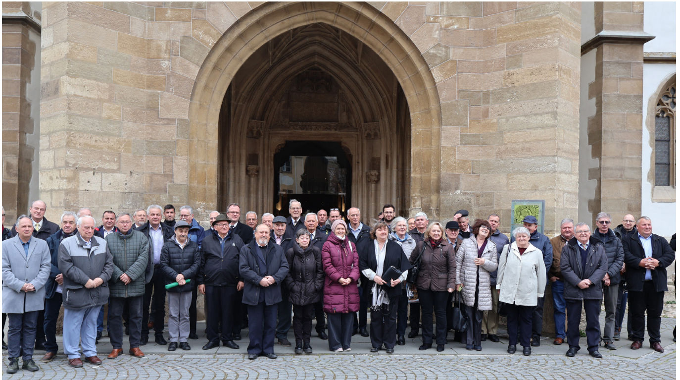
Fast 50 Teilnehmende kamen zum diesjährigen Kuratorentag Ende März nach Hermannstadt.

D rei Themen beschäftigten die rund 50 Teilnehmenden des diesjährigen Kuratorentages Ende März in Hermannstadt. Motto: „Zukunft gestalten – Gemeinschaft leben, neue Strukturen – Gemeindeverbände“. Es ging um gelebte Gemeinschaft in Gemeindeverbänden, um den Stand des Transformationsprozesses innerhalb der Evangelischen Kirche A.B. in Rumänien und um die Gestaltung der Beziehungen der Kirchengemeinden zu ihren jeweiligen Heimatortsgemeinschaften (HOGs) in Deutschland.