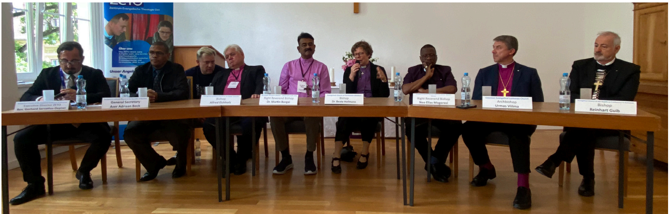
Wie unterschiedlich Ökumene verstanden wird, zeigt sich in der Diskussion mit den sieben Bischöfen.

ter auf, wie eine Kirchenburg als Ort der Bildung funktionieren kann.