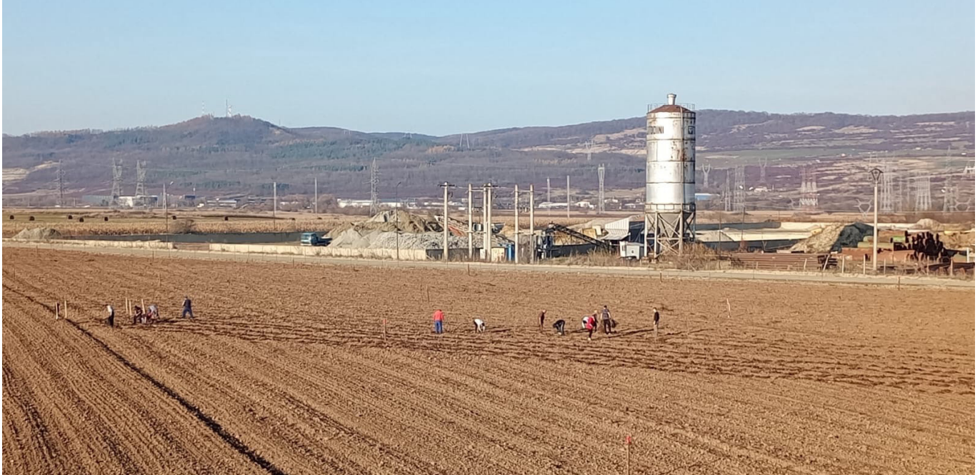
Blick auf das Grundstück bei der Pflanzaktion.

Die Evangelische Kirchengemeinde A. B. Hermannstadt hat einen Wald gepflanzt