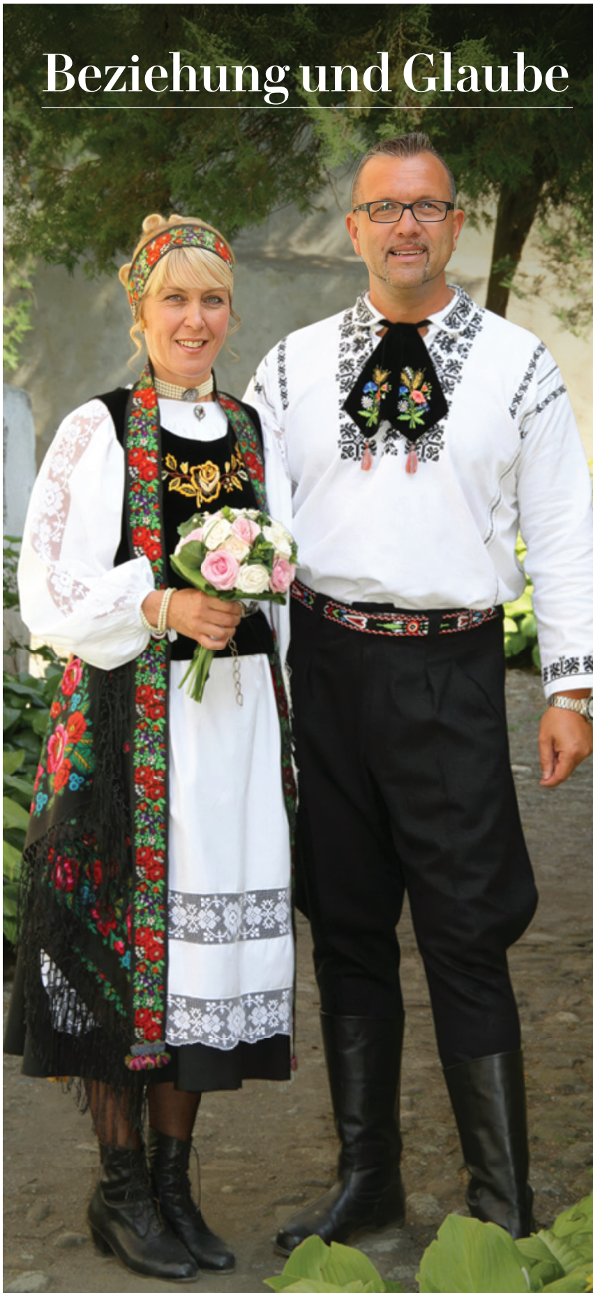
Glaube kann einem Paar Stabilität und Tiefe in der Beziehung geben. Junges Brautpaar vor dem Kirchturm von Hamruden.