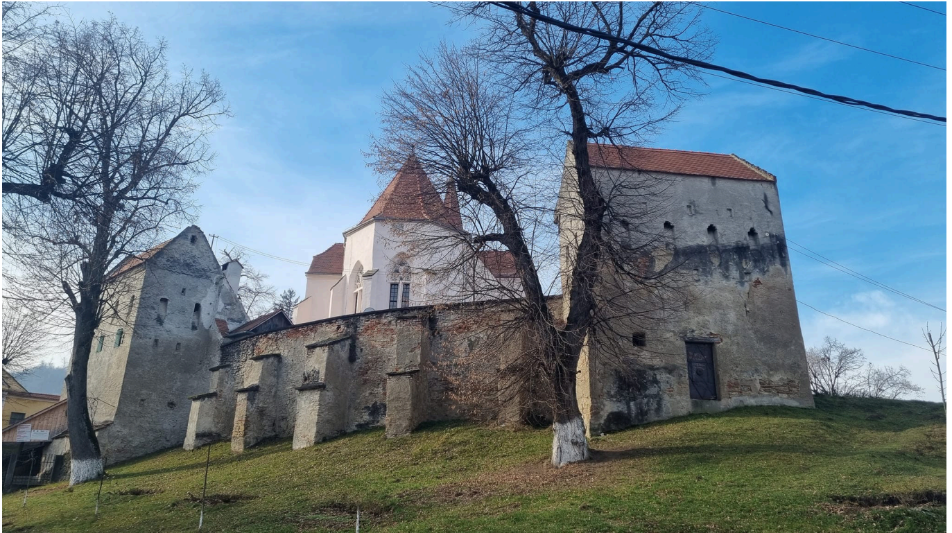
Scharosch an der Kokel nach den Restaurierungsarbeiten durch EU-Förderprogramme.