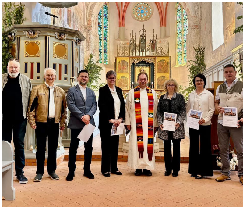
Die Kirchengemeinde Heltau freut sich über sieben neue Mitglieder.