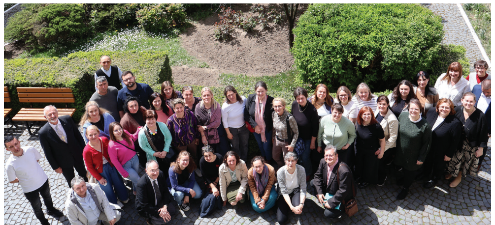
Die verschiedenen Institutionen präsentierten ihre Projekte auf der Tagung.