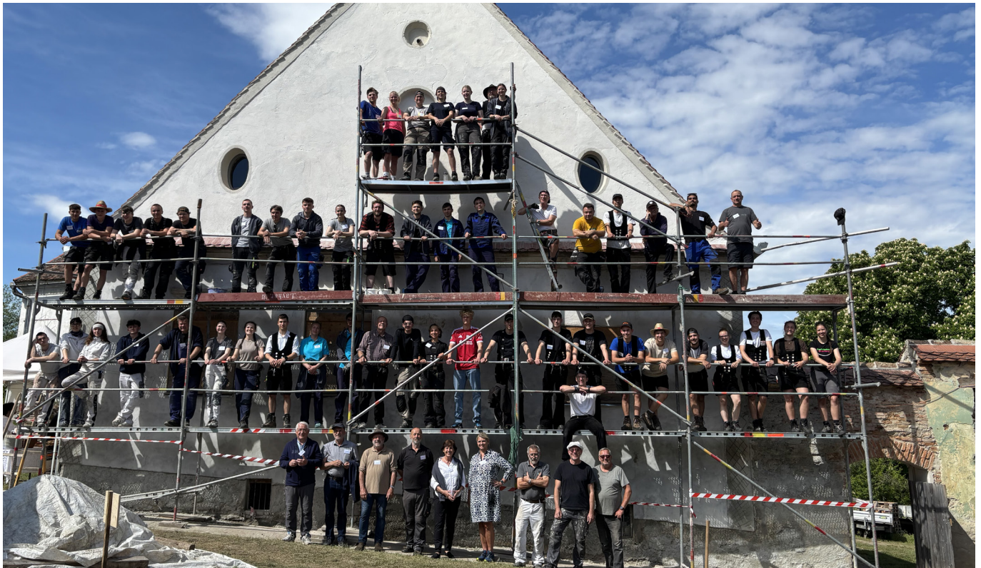
Über 60 Azubis und ihre Ausbilder aus Deutschland aus verschiedenen Bauhandwerken arbeiten in der Kirchenburg Martinsdorf.

In diesem Jahr begann der erste Transilvanian Brunch der Stiftung Kirchenburgen der EKR mit einer ungewöhnlichen Aktion. Rund 60 angehende Handwerker und ihre Ausbilder aus Deutschland empfingen die über 50 Gäste beziehungsweise Teilnehmer des Brunches in Martinsdorf, die zum Auftakt dieser ersten Veranstaltung der Stiftung Kirchenburgen kamen.