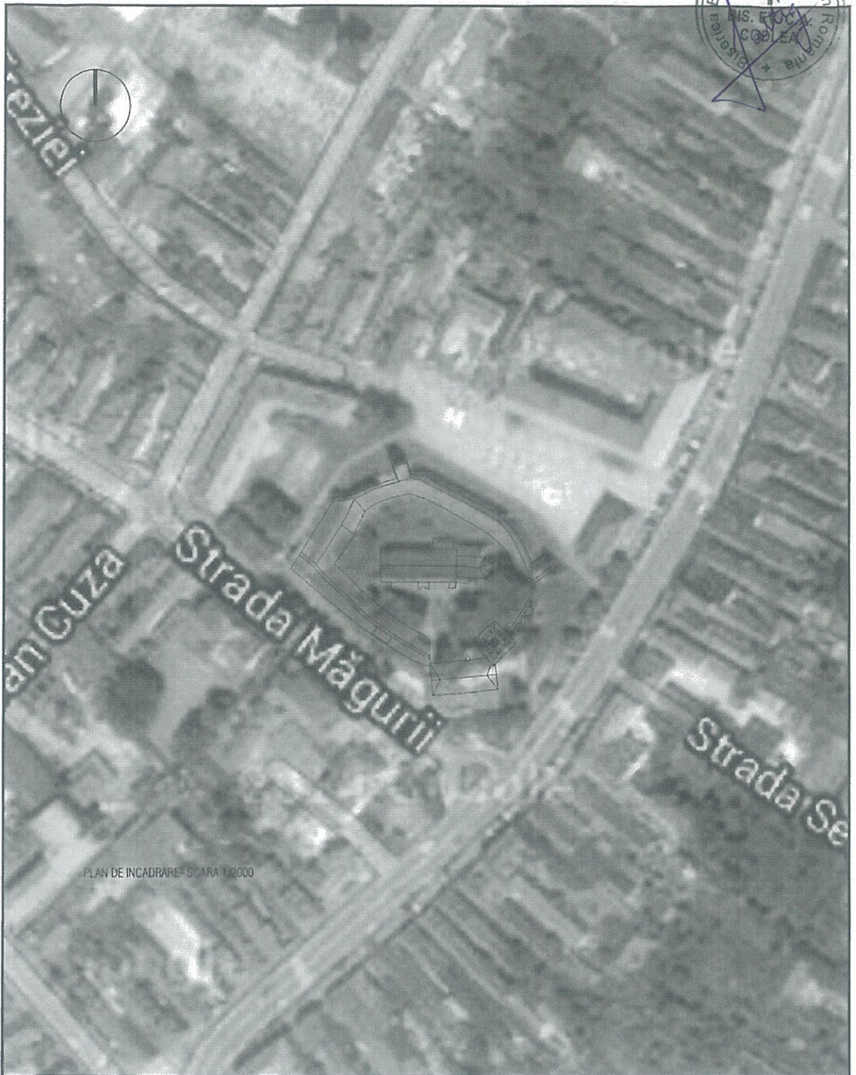
PLAN DE INCADRARE SCARA 1:2000